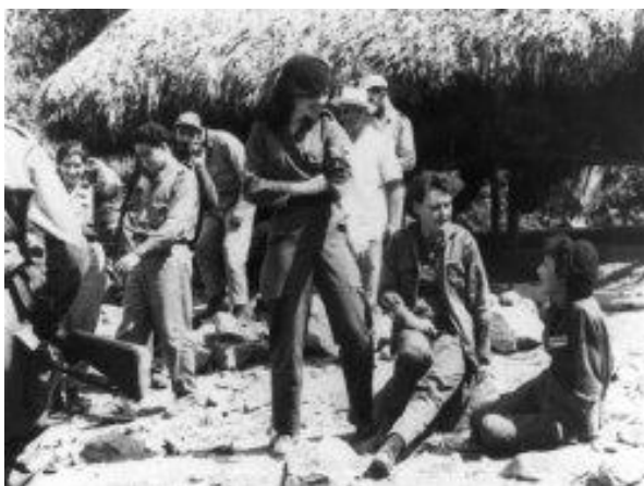
Vilma Espín en la Sierra Maestra durante la Guerra de Liberación Nacional.

Bajo las órdenes directas de Frank País participó en el alzamiento armado de Santiago de Cuba el 30 de noviembre de 1956, en apoyo a los expedicionarios del yate Granma, convirtiéndose su vivienda, después de esta acción relevante, en cuartel general del movimiento revolucionario en Santiago de Cuba.