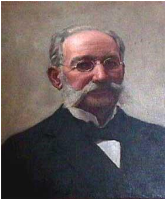
Carlos Juan Finlay

"El futuro de la Humanidad no puede ser este mundo injustificable e insostenible". Fidel Castro Ruz (Mensaje a la II Cumbre Sur del Grupo de los 77 y China, Doha, Katar, 12 de junio de 2005.)