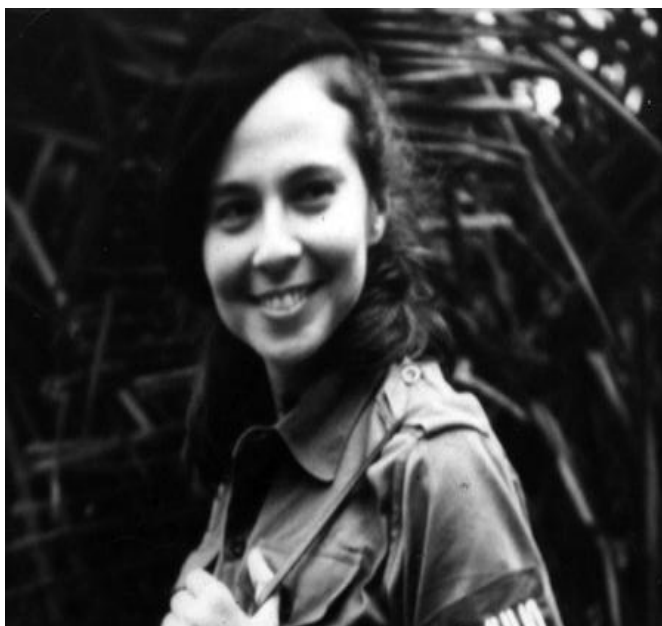
Vilma Espín Guillois

Vilma Espín Guillois, ejemplo de notable virtuosismo.